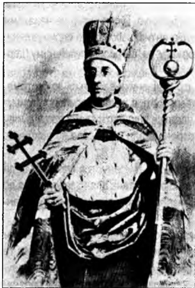
Галицький митрополит кардинал Сильвестр Сембратович

Поштовх відновленню антиалкогольного руху дало листо-