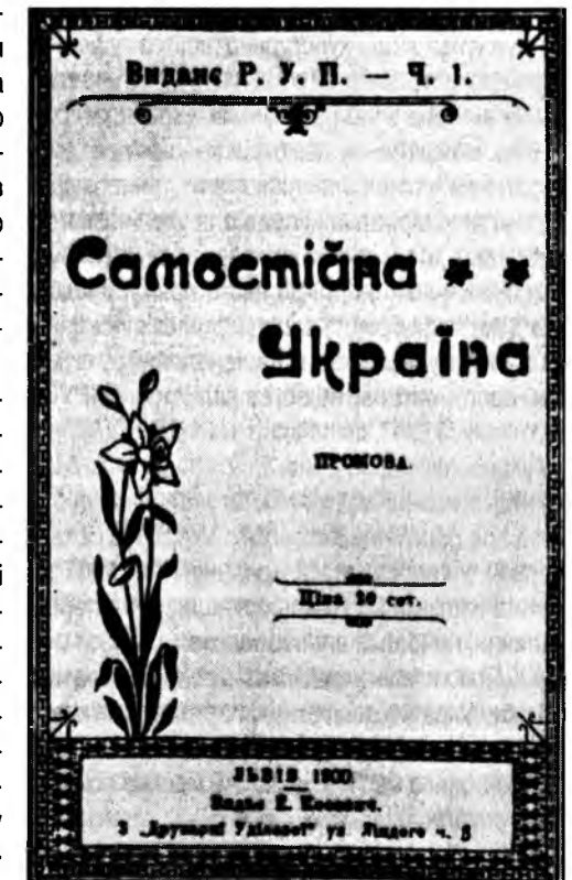
Титульна сторінка праці М. Міхновського „Самостійна Україна“. Львів, 1900 р.

Створення РУП, навколо якої об'єдналися представники різних ідеологічних напрямків, що були незадоволені безпартійними формами громадської діяльності, стало початком формування партійно-політичної системи українського суспільства у Наддніпрянській Україні. Український рух остаточно перейшов зі стадії культурницького українофільства до організованої праці в масах, виступив на політичній арені Росії під прапором національно-державної незалежності 53 . Пізніше на основі РУП сформувався спектр українських політичних партій. Найрадикальніші прихильники самостійності України на чолі з М. Міхновським у 1902 р. вийшли з РУП і заснували Українську народну партію (УНП). Своєрідним маніфестом, катехізисом самостійників став твір М. Міхновського "Десять заповідей УНП" (1903 р.), в якому проголошувалося гасло "Україна для українців": "Одна-Єдина, Неподільна, Самостійна, Вільна, Демократична Україна,