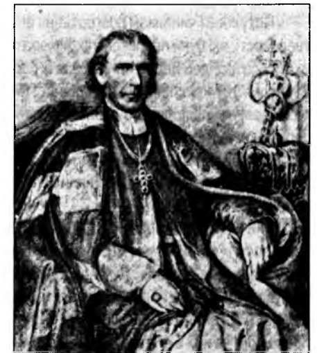
Галицький митрополит Йосиф I Сембратович

На особисте прохання галицького митрополита папа Пій IV у посланні від 30 червня 1874 р. благословив створення братств тверезості серед греко-католицького населення Австрії, надавши їм самостійного статусу та різних "духовних пільг". Спираючись на це, Й. Сембратович 4 серпня того ж року видав статут "О братствах утриманості і об от-