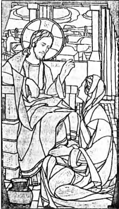
Мал. 1. М. Сосенко „Христос і Самаритянка“. 1907 р. (проект вітража).

М. Сосенко зумів створити оригінальні розписи багатьох залів. У своїх композиціях художник застосовує мотиви народних орнаментів, які дещо стилізовані. Водночас в орнаментальній композиції він уміло втілює тематичні панно з постатями козаків, бандуристів, лірників, сільських хлопчаків 9 .