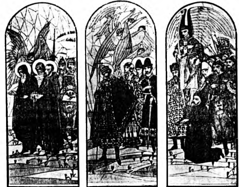
Мал. 3. П. Холодний. Вітраж Волоської Церкви Успенія Пречистої Діви Марії, м. Львів. 1937 р.